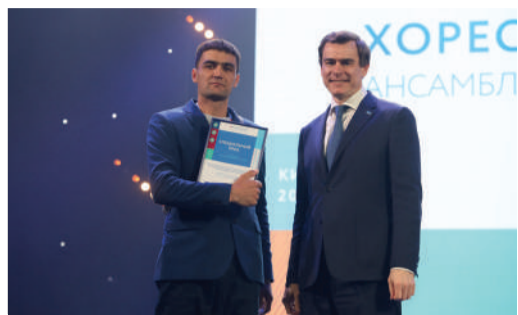
БУРЗЯНСКИЙ КОЛЛЕКТИВ В ТРОЙКЕ ПРИЗЕРОВ