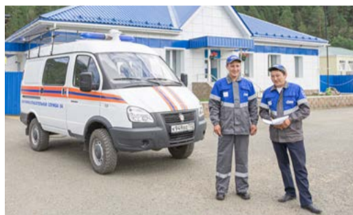
ФИЛИАЛУ В БЕЛОРЕЦКЕ — 60!